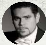
Tamás Kóbor opera singer