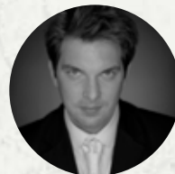
Zsolt Haja opera singer