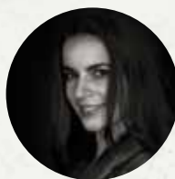
Orsolya Sáfár opera singer