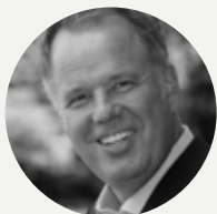
András Pallerdi opera singer