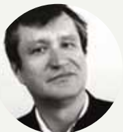
Dénes István karmester