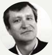
István Dénes conductor