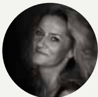
Szilvia Rálik opera singer