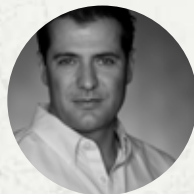
Solymosi Tamás A Magyar Nemzeti Balett igazgatója, az Estély rendezője