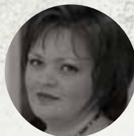
Bernadett Wiedemann opera singer