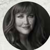
Klára Kolonits opera singer