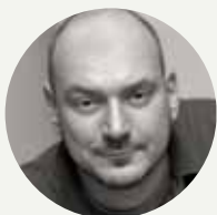
Géza Gábor opera singer