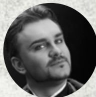
Csaba Szegedi opera singer