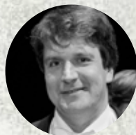
Kollár Imre karmester