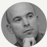
Megyesi Zoltán operaénekes